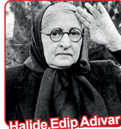
Halide Edip Adivar

İnebolu'da bulunan cephanelerin Ankara'ya götürülmesinde çocuğu ve kağnısıyla yer alırken, ağır kış şartları nedeniyle Aralık 1921'de donarak şehit oldu.